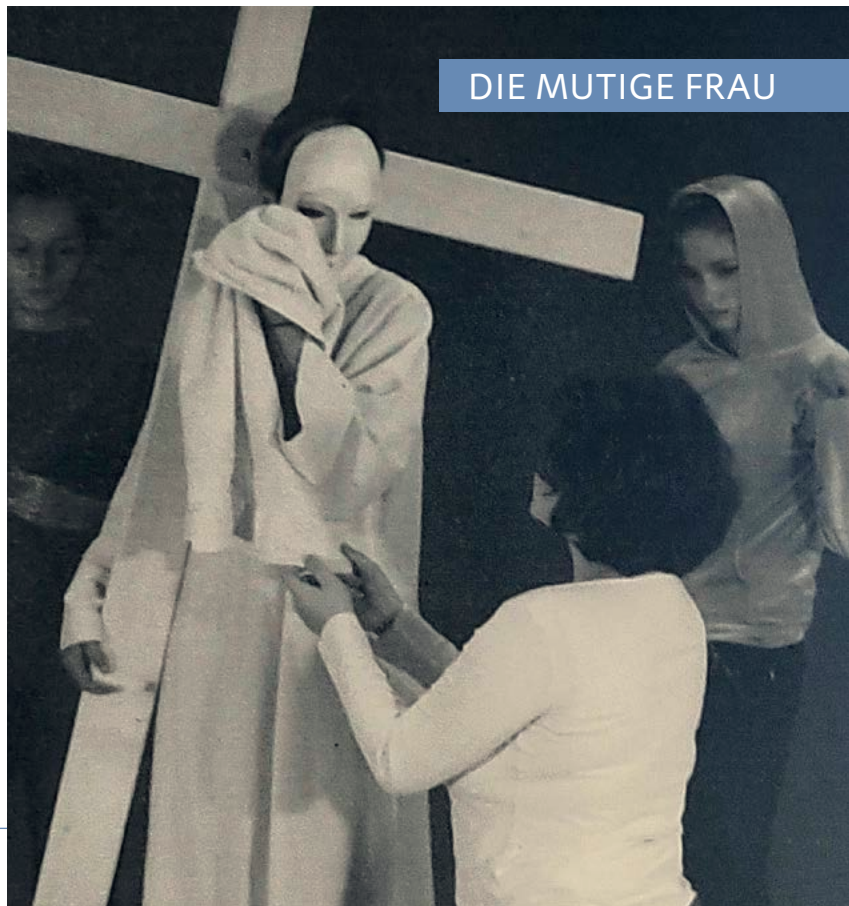
DIE MUTIGE FRAU