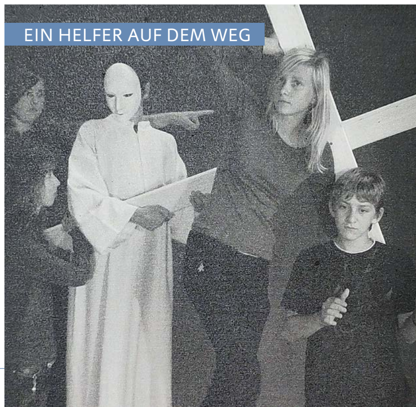
EIN HELFER AUF DEM WEG